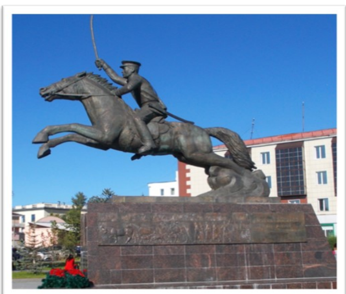
Эки турачыларга тураскаал Кызыл хоорай

ронунуң санитар инструктору болуп, дайынче аъттанып турда, ооң хары чүгле 18 турган .